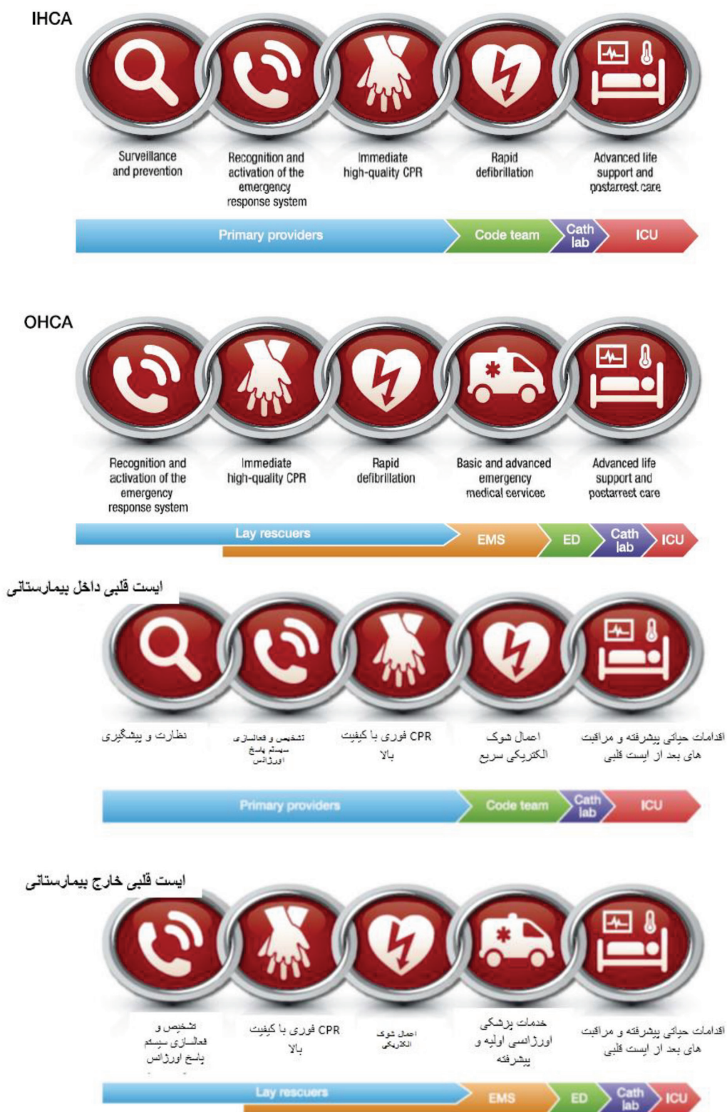
شکل ۱- زنجیره‌های بقای ایست قلبی داخل و خارج بیمارستانی (۱۰)

گیرند. در مقابل، بیمارانی که دچار ایست قلبی در داخل بیمارستان می‌شوند، به تعامل متقابل بخش‌های مختلف بیمارستان و خدمات آن و نیز یک تیم چند رشته‌ای از ارائه دهندگان حرفه‌ای مراقبت