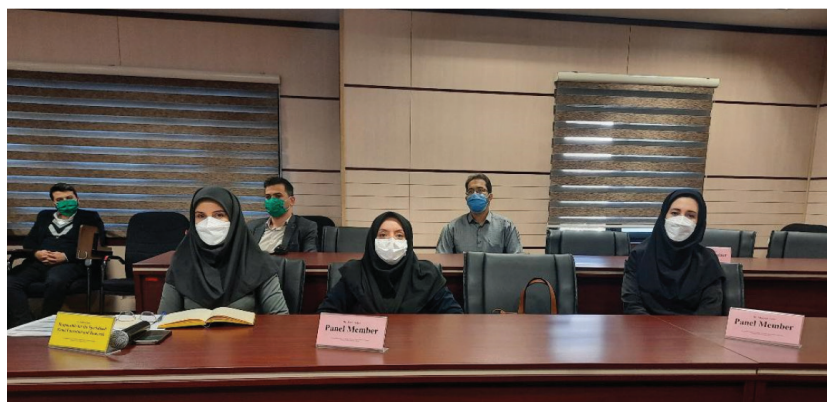
تصویر ۱- پنل آموزش و پژوهش