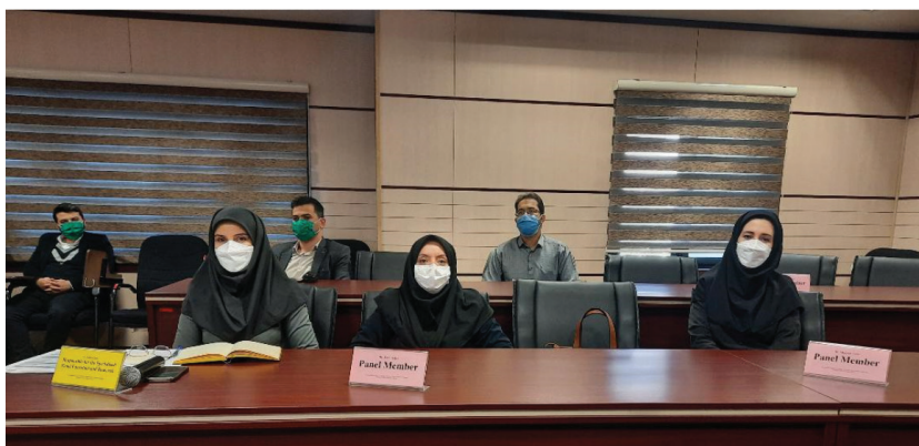
تصویر ۱- پنل آموزش و پژوهش

کمیته بین المللی طب نظامی در سال ۱۹۲۰ و پس از جنگ جهانی اول، با آشکار شدن نیاز به همکاری‌های نزدیک‌تر بین بخش‌های بهداشت و درمان نیروهای مسلح در سراسر جهان، تشکیل شد. اولین کنگره بین المللی طب نظامی در جولای ۱۹۲۱ در بروکسل، بلژیک برگزار گردید اولین کنگره منطقه‌ای آسیا پاسیفیک ICMM در سال ۲۰۱۰ در کشور چین، دومین کنگره در سال ۲۰۱۲ در تایلند، سومین کنگره در سال ۲۰۱۶ در فدراسیون روسیه و چهارمین کنگره در سال ۲۰۱۸ در ایران برگزار شد (۱). سمینار «تجربیات پرستاران در مواجهه با پاندمی کووید-۱۹» (International Seminar on Nursing Experiences about COVID-19 Pandemic) به صورت آنلاین و به زبان انگلیسی در تاریخ ۲۱ مهرماه ۱۴۰۰ (۱۳ اکتبر ۲۰۲۱) توسط ستاد کل نیروهای مسلح جمهوری اسلامی ایران، به میزبانی دانشگاه علوم پزشکی بقیه الله و مشارکت دانشگاه علوم پزشکی ارتش در تهران برگزار شد. در افتتاحیه سمینار دکتر طیب مرادیان دبیر علمی سمینار و